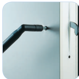
Assemblage facile des panneaux par crochets excentriques