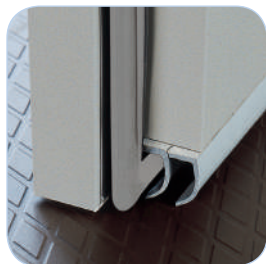
Joint racleur de porte pour une bonne étanchéité

D'une hauteur intérieure de 2 mètres, 2,25 mètres ou 2,4 mètres, les gammes PCR et NCR peuvent se décliner en un nombre important de modèles, selon la largeur et profondeur choisie. La conception modulaire des chambres permet à chaque utilisateur de trouver une chambre adaptée à ses besoins, en fonction de sa production, de son organisation de travail et des contraintes d'implantation de son fournil.