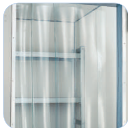
Rideau à lanières en standard sur les négatives