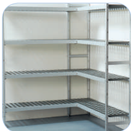
Rayonnage intérieur et éclairage